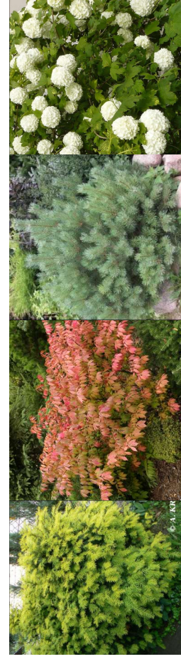
Cis pospolity 'Summergold' Trzmielina oskrzydłona 'Compactus' Sosna pospolita 'Beuvronensis' Kalina korallowa 'Roseum'