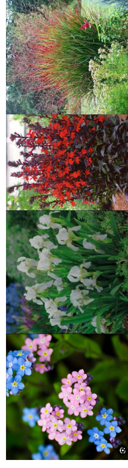
Niezapominajka bielona Kosaciec syberyjski 'Butter and Sugar' Lobelia szkarłatna Proso różgowe 'Rohbraun'