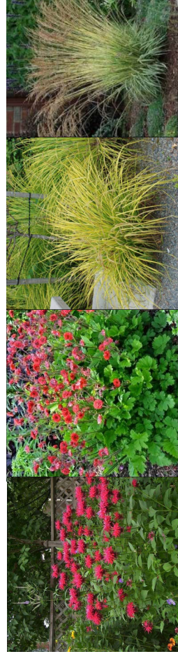
Pysznogłowa ogrodowa 'Flames of Passion' Kuklik zwisy 'Aurea' Turzyca sztywna 'Variegata' Irzėslika modra