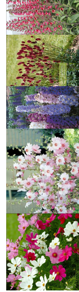
Kosmos podwojnie pierzasty Słazówka karłowa 'Barnsley Baby' Ostrożka ogrodowa 'Magie Fountains' Krwisicąg lekarSKI 'Tanna' Naparstnica 'illumination raspberry'